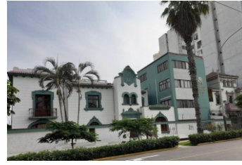
Av. Gral. Santa Cruz 711, Jesús María

Las clases se dictarán en la Unidad de Posgrado de Derecho y Ciencia Política de la UNMSM