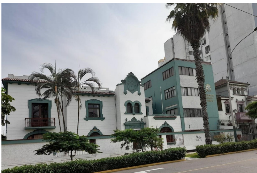
Av. Gral. Sta. Cruz 711, Jesús María

Las clases se dictarán en la Unidad de Posgrado de Derecho y Ciencia Política de la UNMSM